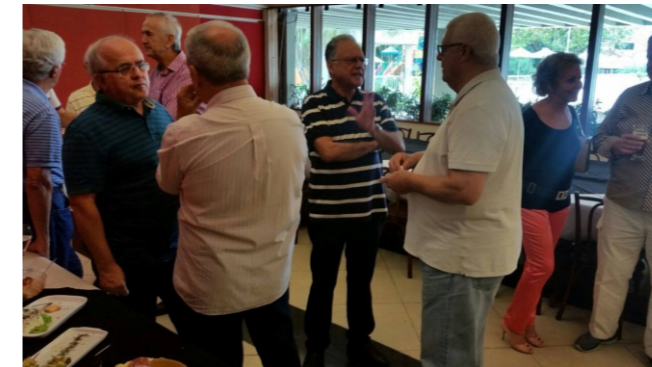
Membros da APASC estiveram reunidos na Barra (RJ).

Outubro foi marcado por dois momentos de celebração que congregaram os associados. No início do mês, o encontro aconteceu no Rio de Janeiro (RJ) e, além de muita conversa, contou com sorteio de quatro relógios e quatro vales-brinde para os associados de todo o Brasil. Já no final do mês, foi realizado o Encontro Anual dos Administrativos Aposentados da Souza Cruz em Balneário Camboriú (SC). "Pride in tobacco" foi o tema da celebração, que ganhará repetição no mesmo período de 2018.