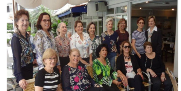
Associados se reuniram no Sul e já tem data para 2018.